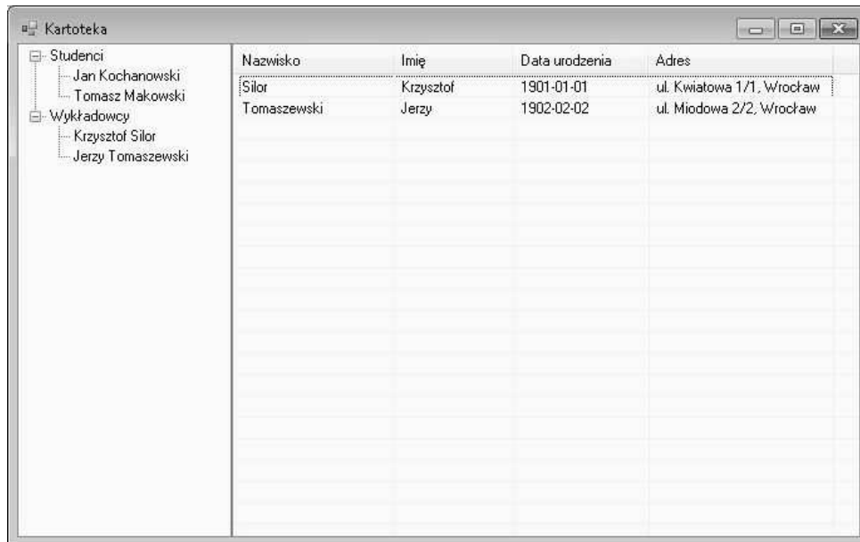
Rysunek 1: Rysunek do zadania 2

Za każdy z w/w powiadomień jest jeden punkt.