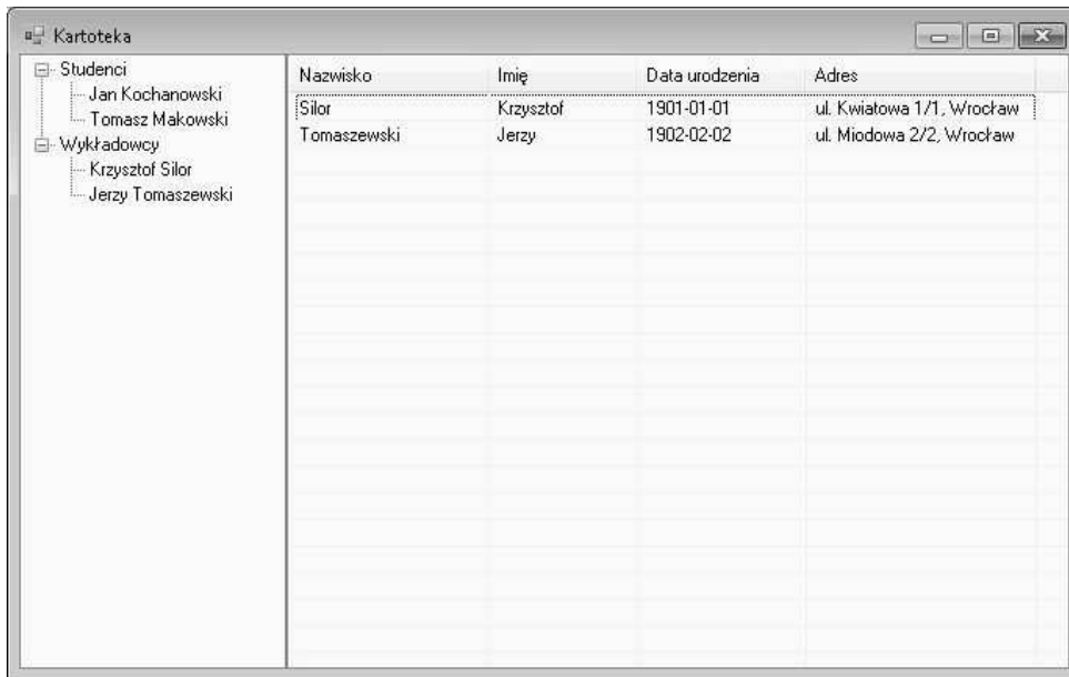
Rysunek 1: Rysunek do zadania ??

Za każdy z w/w powiadomień jest jeden punkt.